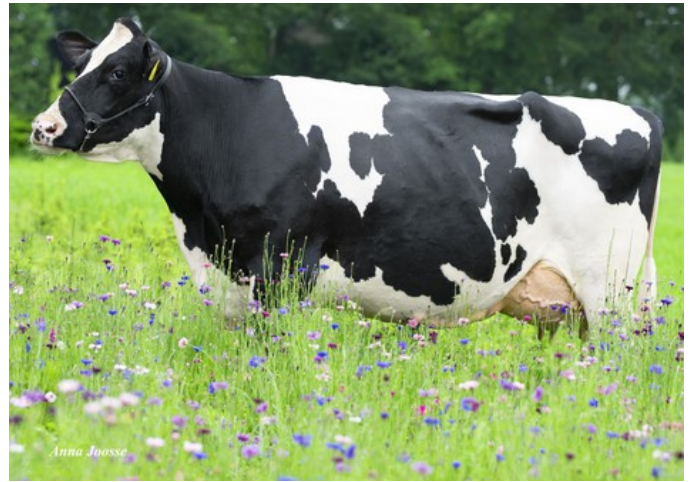
De Oosterhof Dg Rose RDC VG-89

Marble-Red x GP-84 AltaAltuve RDC x VG-86 Salvatore Rc x VG-89 Rubicon x GP-83 Aikman RDC x VG-85 Man-O-Man x VG-87 Mascol x VG-88 Durham x EX-90 Rudolph x EX-95 Chief Mark