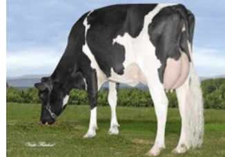
Gen-I-Beq Bolton Silence VG-85