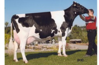
Gen-I-Beq Durham Sherry VG-87

Freestyle-Red x Rubels-Red x GP-84 Salvatore Rc x Rubicon x GP-83 Cashcoin x VG-87 Snowman x EX-90 Planet x VG-85 Bolton x VG-87 Goldwyn x VG-87 Durham