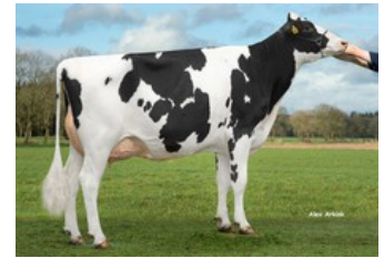
Tirsvad K&L Riveting Magnolia GP-84