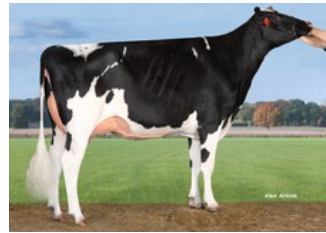
Pen-Col Superhero Mistral EX-91