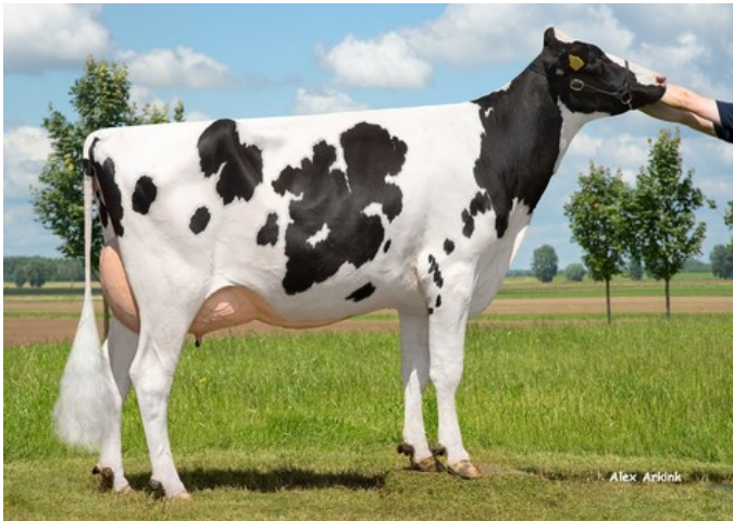
3STAR OH Mariska RDC GP-82