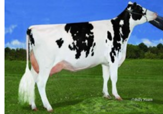
Ms Gold-N-Oaks Maybaline VG-88