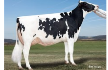
Gold-N-Oaks Arabell 1765 VG-88,

GP-82 Ranger-Red x GP-84 Riveting x EX-91 Superhero x Silver x GP-82 Supersire x VG-87 Bookem x VG-88 Man-O-Man x VG-89 Shottle x EX-94 Morty x VG-87 Marshall