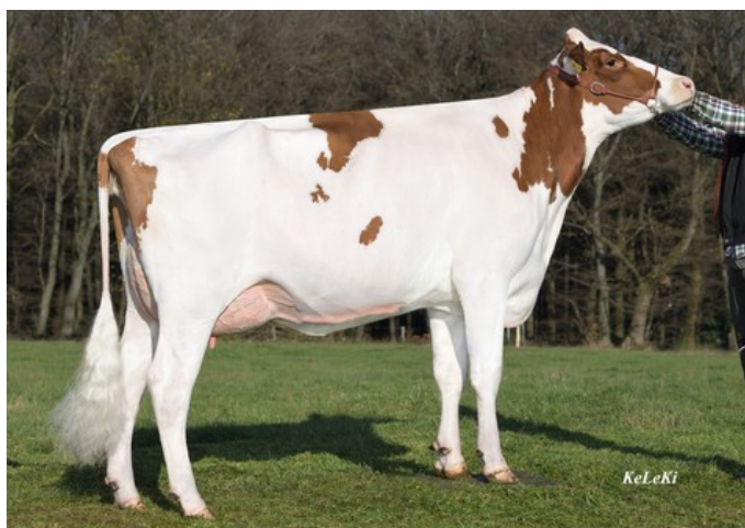
KNS Discogirl P Red VG-87