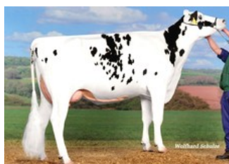
KNS Dreambaby VG-85