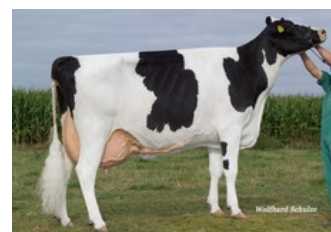
KNS Daybright EX-91