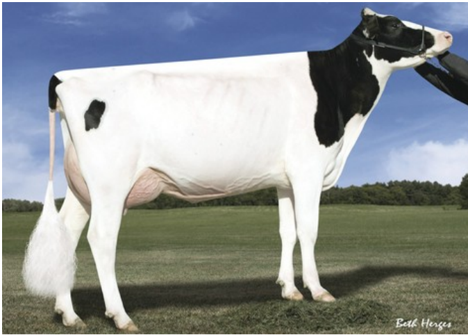
Des-Y-Gen Planet Silk EX-90