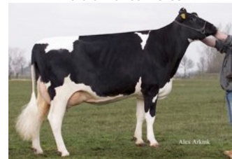
Sunday ALH Prudence VG-88

Gnabry RDC x GP-83 Andy-Red x GP-82 Apprentice RDC x VG-89 Rubicon x GP-83 Aikman RDC x VG-85 Man-O-Man x VG-87 Mascol x VG-88 Durham x EX-90 Rudolph x EX-95 Chief Mark