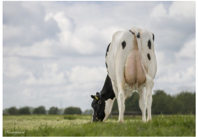
PR Shauny VG-88

VG-87 Arrow x GP-83 Pharo x VG-88 Modesty x GP-83 McCutchen x VG-87 Man-O-Man x EX-92 Planet x VG-86 Shottle x VG-86 O Man x EX-92 Rudolph x EX-90 Bell Elton