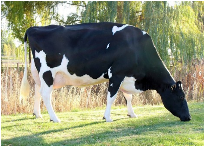
Ammon-Peachey Shauna EX-92