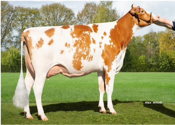
Sudena Alice Red VG-86