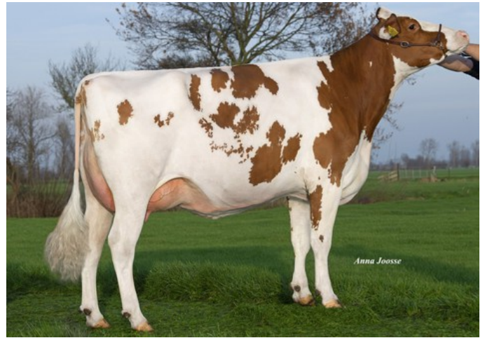
Batouwe Ailisha Salva Red VG-85

VG-86 Freestyle-Red x VG-86 Rubels-Red x VG-85 Salvatore Rc x VG-89 Rubicon x VG-87 Supersire x VG-85 Alexander x EX-91 Goldwyn x EX-95 Durham x EX-93 Prelude x EX-94 Jubilant RF