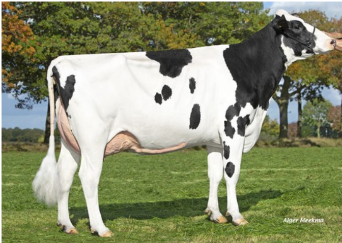
HET Agro Gazelle ET VG-85