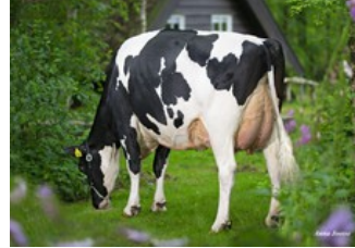
De Oosterhof Dg Rose RDC VG-89