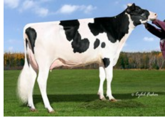
Jenniton M-O-M Savana-Et EX-90