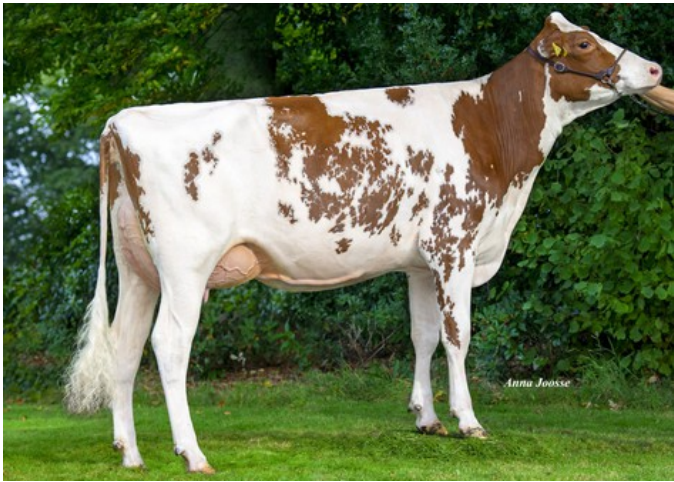
Salsa P Red VG-87