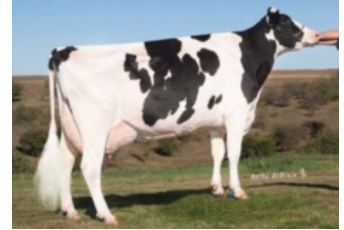
Jenniton Bolton Rowena EX-90

VG-87 Money P x VG-86 Stormy Red x GP-83 Salvatore Rc x Yoder x VG-85 Donatello x EX-90 Man-O-Man x EX-90 Bolton x EX-90 Boss Iron x EX-90 Rudolph x VG-88 Chief Mark