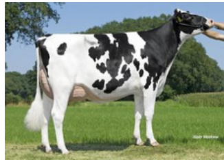
Schreur Serena 13 PP RDC VG-87