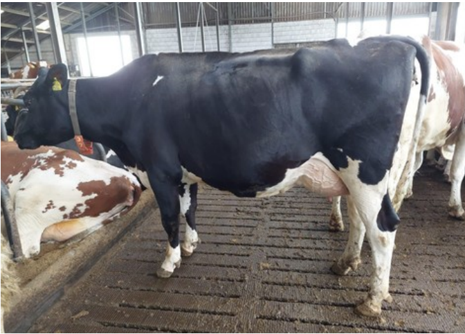
3STAR Poppe Gazelle GP-84