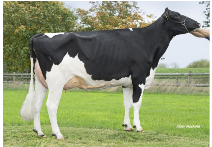
Poppe K&L Gorgina

GP-84 Gladius x Durable x VG-88 Gymnast x VG-87 Rubicon x VG-89 Shotglass x VG-88 Windbrook x VG-88 Jeeves x VG-85 Goldwyn x VG-85 Juror Ford x VG-85 Cleo