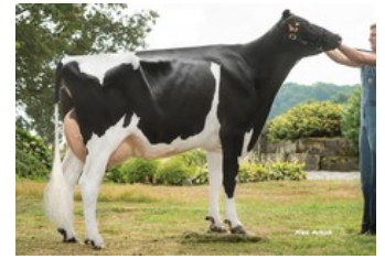
Maybelline Tual VG-85