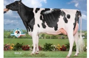
Hermine Tual, family of Maybelline

GP-84 Pinball x Crimson x Granite x VG-85 Rubicon x GP-84 Cashcoin x VG-86 Man-O-Man x VG-86 Shottle x GP-84 Finley x Brett x Lantz