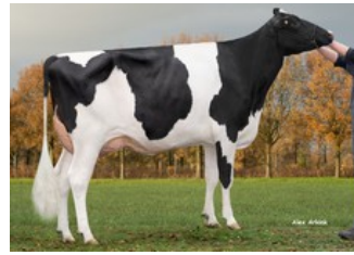
K&L OH Mabel