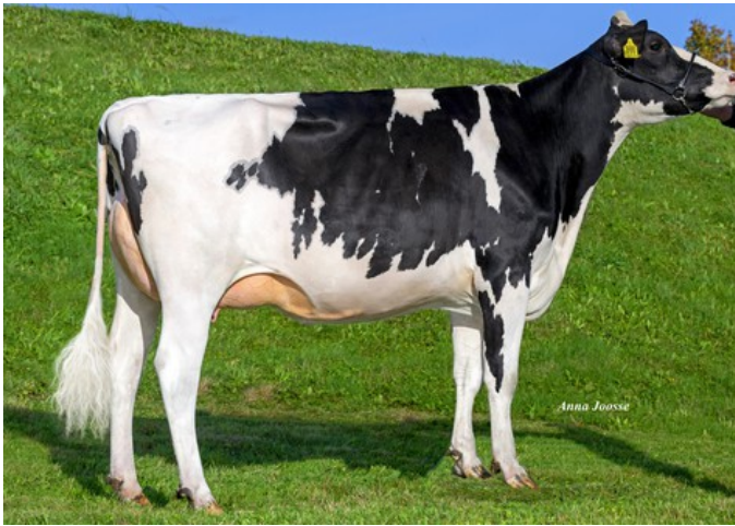
3STAR OH Maiball GP-84