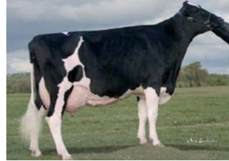
Glenn-Ann Durham Pepper EX-90