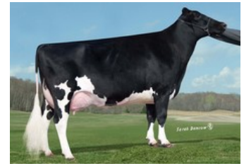
Glenn-Ann Shottle Pepper EX-90