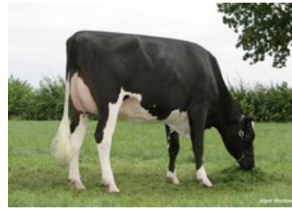
Excellence Mac Melissa VG-87