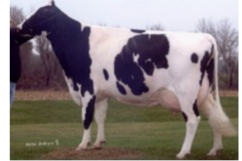
Glenn-Ann Miss Pepperdine VG-89

VG-87 Snowman x VG-87 Mac x EX-90 Shottle x EX-90 Durham x VG-89 Rudolph x VG-87 Formation x VG-85 Blackstar x VG-87 Chief Mark