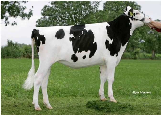
Bacchus Pepper 7 VG-87