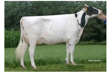
Zandenburg Twist. Ebony EX-90