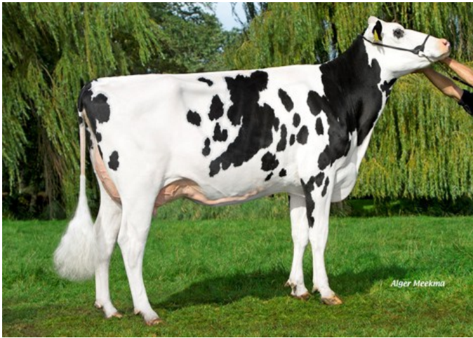
Caudumer Ebony 2 VG-88