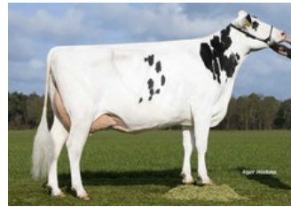
Zandenburg Snowman Ebony 1 EX-90