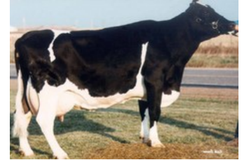
Rocky-Vu Mars Esthe Extasy VG-87

AltaTop-Red x VG-86 Jacuzzi-Red x VG-88 Finder x Boss x EX-90 Snowman x EX-90 Twister x VG-86 Goldwyn x VG-86 Lancelot x VG-87 Webster x VG-89 Lucky Leo