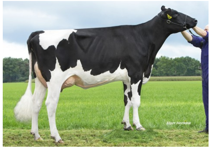
Diepenhoek Rozelle 65 VG-87

VG-85 Einstein x VG-89 Kenobi x VG-85 Rubi-Agronaut x Superman x VG-87 Mogul x VG-86 Sandy x VG-87 Shottle x VG-87 Jesther x VG-89 Ronald x EX-91 Southwind