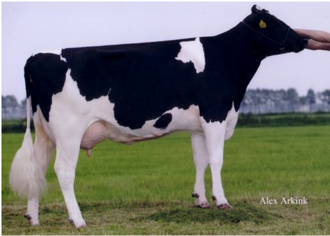
Diepenhoek Rozelle 4 VG-87