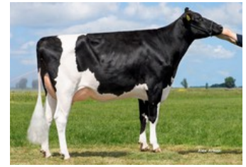
K&L Poppe Gonda VG-86