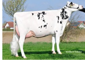
SPH Gallerie VG-86