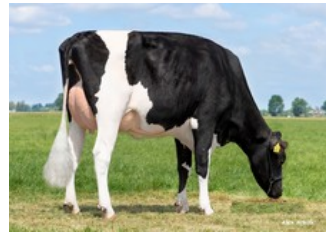
K&L Poppe Gonda VG-86