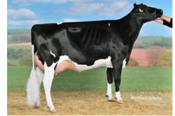
Tirsvad Beacon Galaxy VG-85

G-79 Gigabyte x VG-86 Rubi-Agronaut x GP-84 Cinema x VG-86 Shotglass x VG-85 Beacon x VG-88 Juwel x VG-86 O Man x VG-87 Aaron x EX-91 Esquimau x VG-89 Lucky Leo