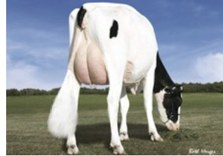
Des-Y-Gen Planet Silk EX-90