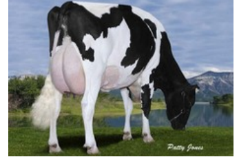
Gen-I-Beq Goldwyn Secret RC VG-87

VG-86 Ronald RC x VG-88 Styx Red x Rubicon x GP-83 Cashcoin x VG-87 Snowman x EX-90 Planet x VG-85 Bolton x VG-87 Goldwyn x VG-87 Durham x VG-86 Formation