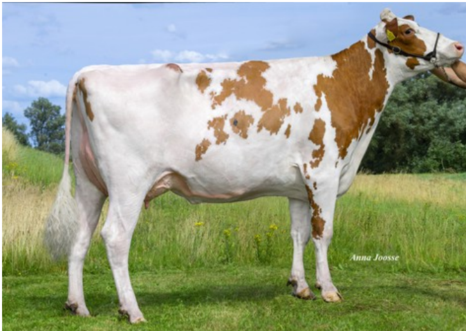
R&B Altatop Aivy Red