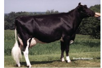
Tolare Rudolph Cupid, zus v Jimtown

VG-87 Einstein x Granite x VG-85 Rubicon x GP-84 Cashcoin x VG-86 Man-O-Man x VG-86 Shottle x GP-84 Finley x Brett x Lantz x VG-85 Jimtown