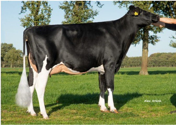
3STAR OH Martini VG-87