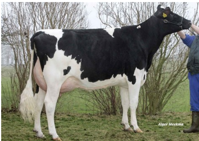
Mars Froukje 376 VG-88