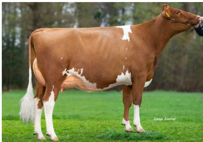
Oelhorst Froukje 837, Andy-Red granddaughter of Funny P Red VG-89

VG-86 Solitair P Red x VG-85 Wisent RF x VG-89 Fun P x VG-86 Fageno x VG-87 Destry RDC x VG-88 Shottle x VG-86 Champion x VG-89 Novalis x VG-87 Pinkpop x VG-86 Sunny Boy