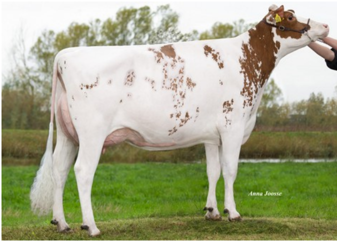
K&L SK Konzert Red VG-89