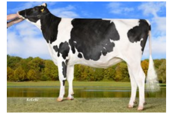
Wilder Konzert RDC