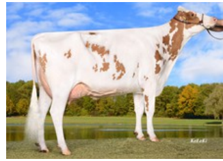
Wilder K25 Red EX-90