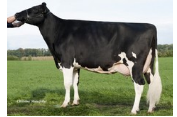
Wilder Kairo 55 RDC VG-89

GP-83 Swingman Red x VG-89 Silky Red x Battlecry x EX-90 Brekem RDC x VG-88 Snowman x VG-89 Shottle x VG-88 Ramos x GP-84 Danube-Red