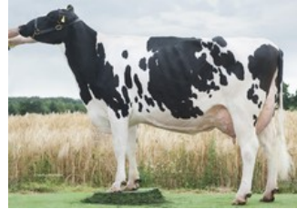
Wilder Kanu 111 RDC VG-88