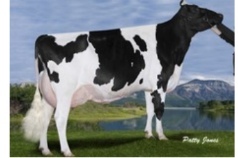
Gen-I-Beq Goldwyn Secret RC VG-87

Rubels-Red x GP-84 Salvatore Rc x Rubicon x GP-83 Cashcoin x VG-87 Snowman x EX-90 Planet x VG-85 Bolton x VG-87 Goldwyn x VG-87 Durham x VG-86 Formation