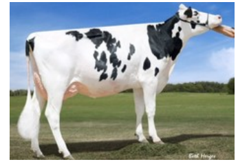
Dymentholm Sunview Sunday VG-87