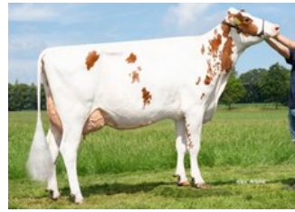
K&L SV Sunny Red GP-84