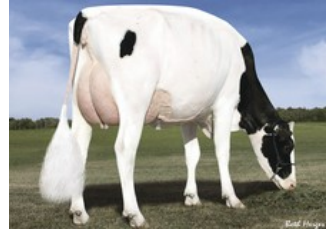
Des-Y-Gen Planet Silk EX-90