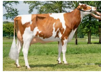
Kalibra SX 5631 Red VG-87