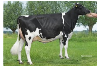
Wilder Kalibra RDC VG-88