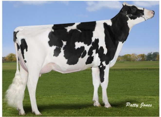
Gen-I-Beq Snowman Summer RDC VG-85

AltaDateline x Rubi-Asp*Rc x Supershot x VG-85 Sympatico RF x VG-85 Snowman x VG-87 Bolton x VG-87 Goldwyn x VG-87 Durham x VG-86 Formation x VG-88 Aerostar