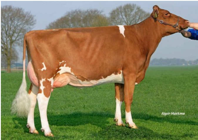
FG Massia 106 VG-86