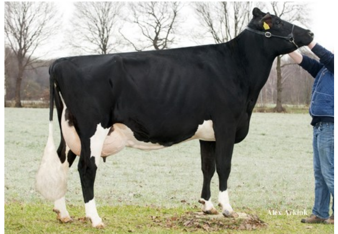
Apina Massia 102 RDC EX-90

Aikman RDC x VG-85 Colt P x VG-86 Kylian x EX-90 Shottle x EX-90 Lentini x VG-85 Tulip x VG-86 Andries x VG-85 Jubilant RF