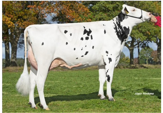
HET Sound Chenile VG-86

VG-87 Soundcloud x VG-86 Sound System x VG-87 Balisto x VG-87 Beacon x VG-86 Ramos x EX-90 Outside x EX-93 Ked Juror x VG-85 Lindy x VG-87 Inspiration