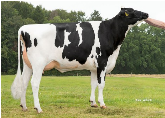
HET SC Charlene VG-87