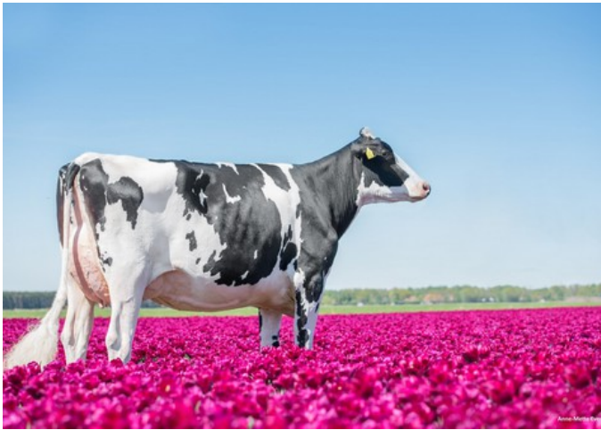
Drouner K&L Classy VG-87