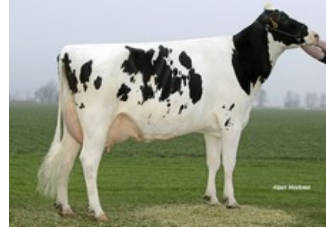
Koepon Shot Classy 17 VG-85