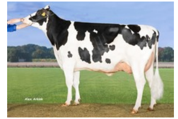
Koepon Oak Classy 4672 GP-83