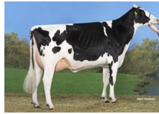
Koepon Mano Classy 90 VG-85