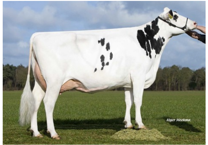
Zandenburg Snowman Ebony 1 EX-90

VG-86 Jacuzzi-Red x VG-88 Finder x Boss x EX-90 Snowman x EX-90 Twister x VG-86 Goldwyn x VG-86 Lancelot x VG-87 Webster x VG-89 Lucky Leo x VG-86 Bellwood