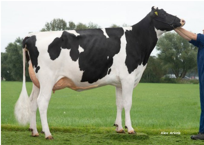
Holbra Joy 1 VG-88