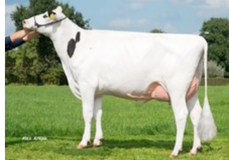
Holbra Sandoya VG-86