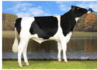
Holbra Escape SG-ET