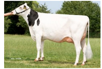
Holbra Joy VG-87