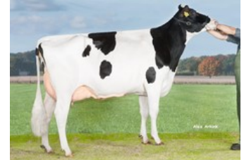
Holbra Sandian VG-88

VG-88 Casper x VG-87 Jedi x VG-86 Kingboy x VG-88 Meridian x VG-89 Snowman x VG-85 Bolton x VG-87 O Man x EX-90 Morty x VG-88 Durham x EX-90 Rudolph