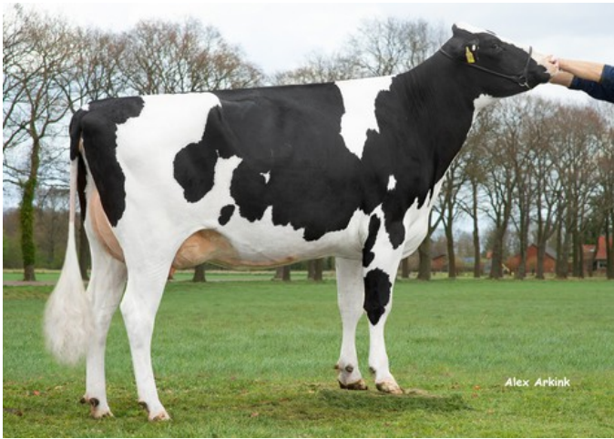
Basic PP RDC GP-83