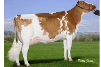
Misty Springs MB Brighter Red VG-87

GP-83 Hotspot P x VG-87 Hologram-P x GP-83 Chipper-P x GP-84 Bookem x VG-86 Man-O-Man x VG-87 Mr Burns RC x VG-88 September Storm x VG-88 Talent x VG-87 Dragon RDC x VG-88 Milestone Red