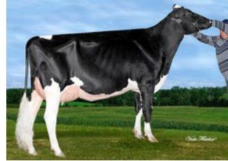
Misty Springs MOM Brenna RDC VG-