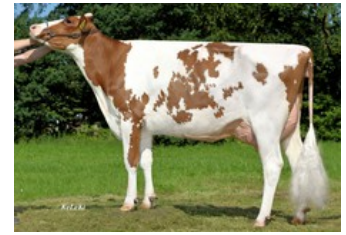
MAR Belami P Red GP-83