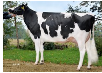
Brigitta PP RDC VG-87