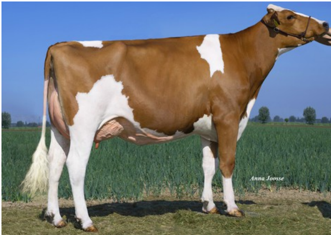
K&L RM Sarina P Red VG-88