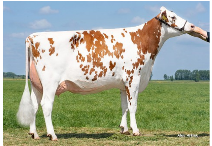
K&L RM Soraya Red VG-85

VG-88 Jim P-Red x VG-85 Breaker RDC x VG-86 Brekem RDC x VG-87 Alchemy RDC x VG-85 Gerard x VG-87 Bolton x VG-87 Goldwyn x VG-87 Durham x VG-86 Formation x VG-88 Aerostar