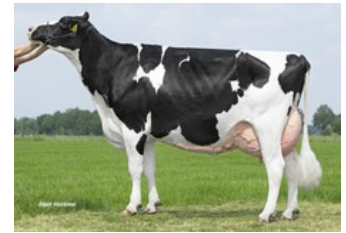
Holbra Malon 3 VG-88