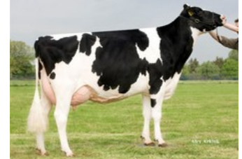
Holbra Pam VG-87

VG-87 Cameron x VG-88 Board x VG-88 Balisto x VG-87 Man-O-Man x VG-87 Mascol x VG-88 Durham x EX-90 Rudolph x EX-95 Chief Mark x EX-91 Sexation x EX-93 Elevation