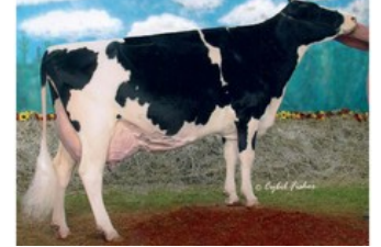
MS Kingstead Chief Adeen EX-94

GP-81 Casper x VG-85 Rubicon x Racer x VG-88 Supersire x VG-87 Shottle x EX-91 Goldwyn x EX-92 Outside x EX-94 Skychief x EX-94 Starbuck x Sheik