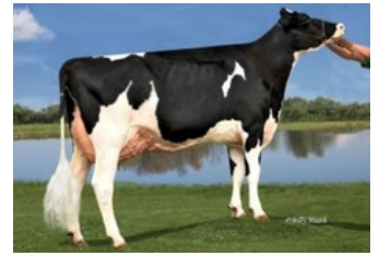
KY-Blue GW Dana EX-91