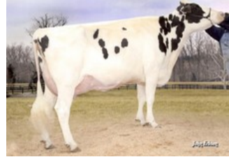
BVK Outside Diana EX-92