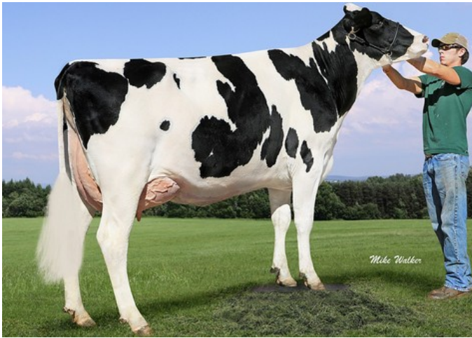
Farnear-TBR-BH Valour VG-88