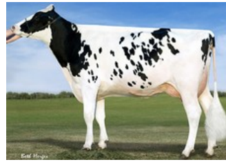
Vision-Gen SH Sho A12037 VG-87