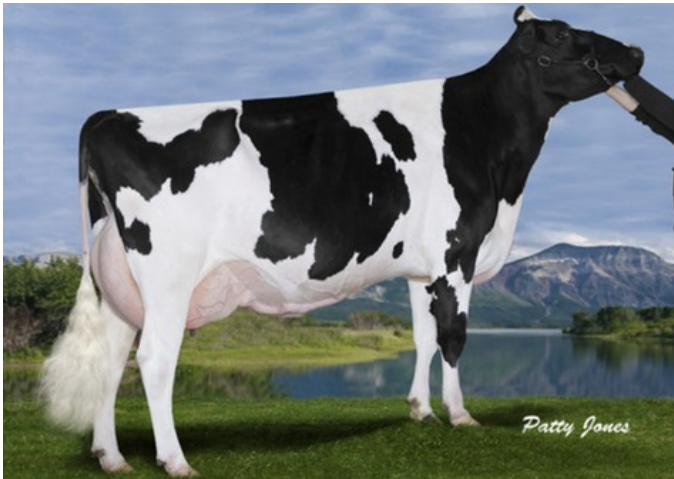
Gen-I-Beq Goldwyn Secret RC VG-87