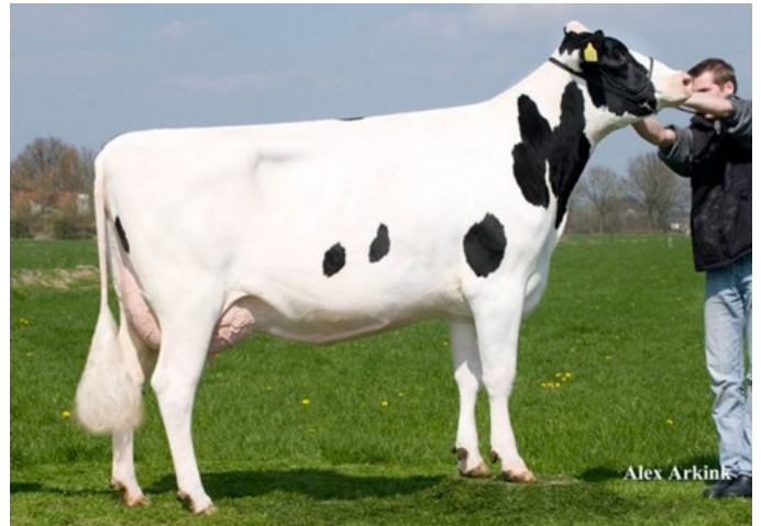
Holbra Paulona VG-85

VG-88 Adorable x Dozer x VG-85 Supersire x VG-88 Snowman x VG-85 Bolton x VG-87 O Man x EX-90 Morty x VG-88 Durham x EX-90 Rudolph x EX-95 Chief Mark