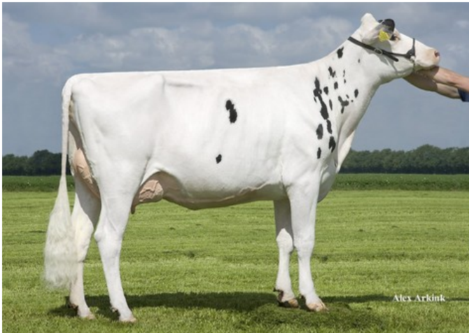
Holbra Lady Snow VG-88