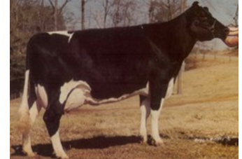
Rilara Mars Las Ravena EX-91

GP-80 King Royal x VG-86 Silver x VG-86 Supersire x VG-85 Bronco x VG-86 Jefferson x VG-88 Laudan x VG-87 Convincer x EX-90 Airliner x GP-84 Mountain x VG-86 Melwood