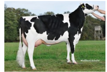
WEH Bronco Janet VG-85