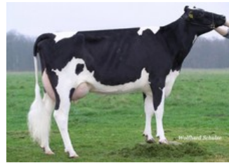
WEH Janne VG-86