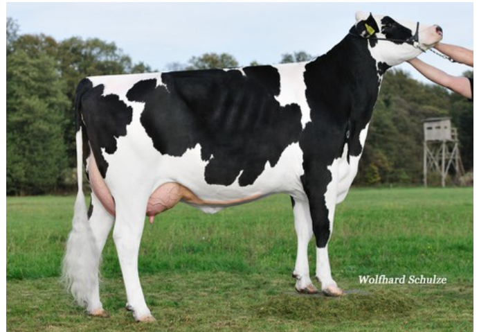
WEH Bronco Janet VG-85

GP-81 King Royal x VG-86 Silver x VG-86 Supersire x VG-85 Bronco x VG-86 Jefferson x VG-88 Laudan x VG-87 Convincer x EX-90 Airliner x GP-84 Mountain x VG-86 Melwood