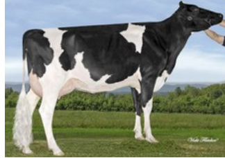
Gen-I-Beq Bolton Silence VG-85