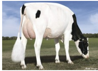
Des-Y-Gen Planet Silk EX-90