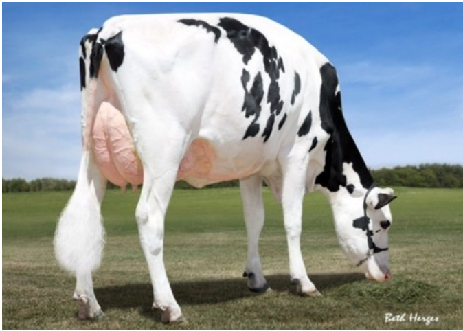
Dymentholm Sunview Sunday VG-87