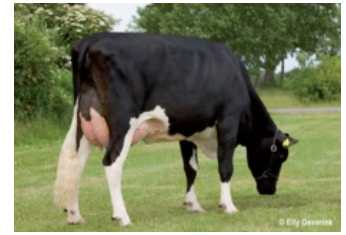
Tirs vad Juwel Ghana VG-88