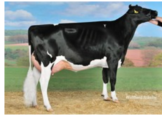
Tirs vad Beacon Galaxy VG-85