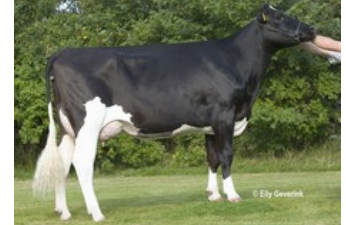
Tirs vad OMan Geneve VG-86

GP-83 Adorable x GP-84 Cinema x VG-86 Shotglass x VG-85 Beacon x VG-88 Juwel x VG-86 O Man x VG-87 Aaron x EX-91 Esquimau x VG-89 Lucky Leo x Scotty