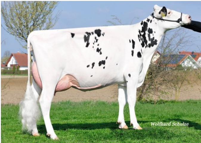
SPH Gallerie VG-86