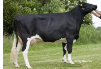
Tirs vad Juwel Ghana VG-88