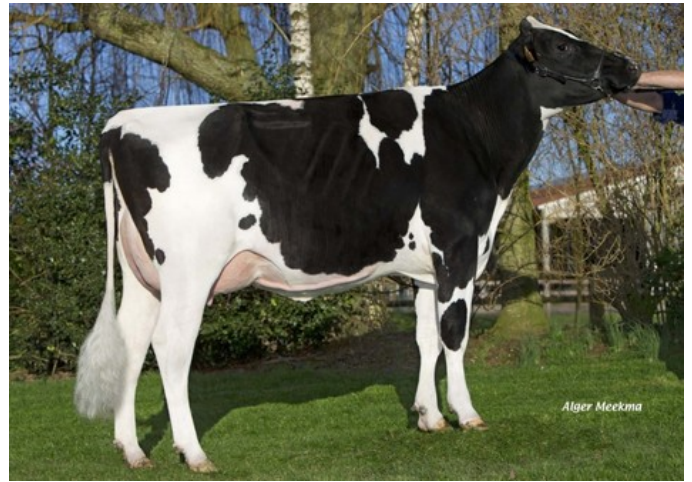
Roccafarm Beacon Chrissy VG-87

VG-86 Adorable x VG-87 Balisto x VG-87 Beacon x VG-86 Ramos x EX-90 Outside x EX-93 Ked Juror x VG-85 Lindy x VG-87 Inspiration