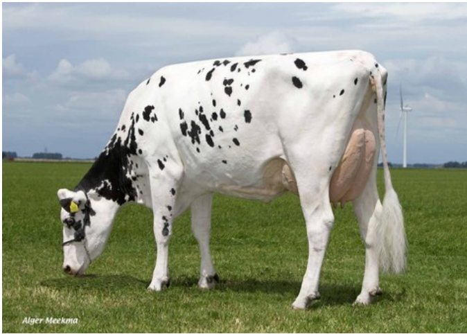
Giessen Snowman Cinderella VG-87