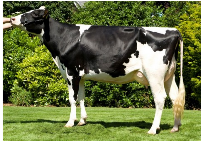
Giessen Cinderella 22 VG-85

VG-87 Bandares x VG-86 Kingboy x VG-87 Snowman x VG-85 Bolton x EX-91 Shottle x VG-89 Durham x EX-92 Encore x VG-88 Mark Cinder x EX-96 Tony x EX-94 Triple Threat