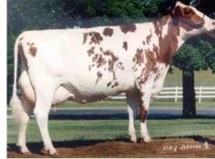
S-F-L Enhancer Scarlette-Red VG-89