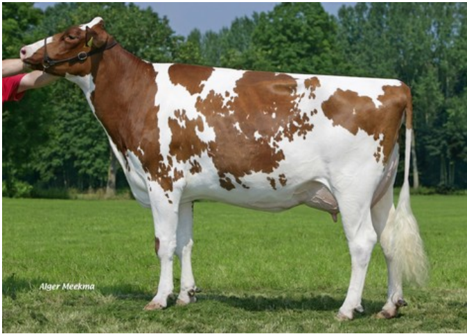
Verhages Bos Candlelight P Red VG-86