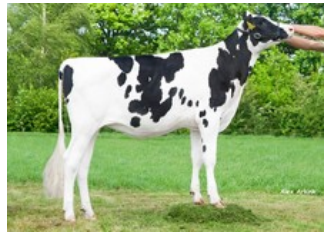
K&L BL Candle P RDC