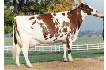
Stookey Fgn Scarlet-Red EX-94

GP-83 Euclid x Balisto x VG-86 Lawn Boy P-Red x VG-87 Shottle x VG-87 Marmax x VG-86 Patron x VG-87 Aerostar x VG-89 Enhancer x EX-94 Fagin x EX-95 Crystan