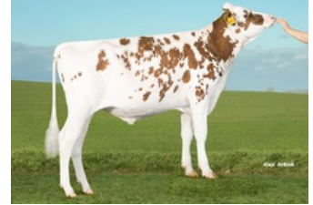
K&L RM Santorin

VG-85 Breaker RDC x VG-86 Brekem RDC x VG-87 Alchemy RDC x VG-85 Gerard x VG-87 Bolton x VG-87 Goldwyn x VG-87 Durham x VG-86 Formation x VG-88 Aerostar x EX Enhancer