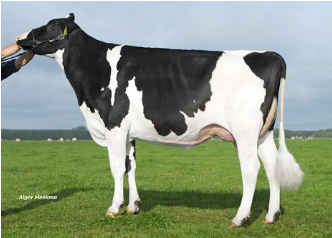
Drouner DH Aiko 1456 RDC VG-88