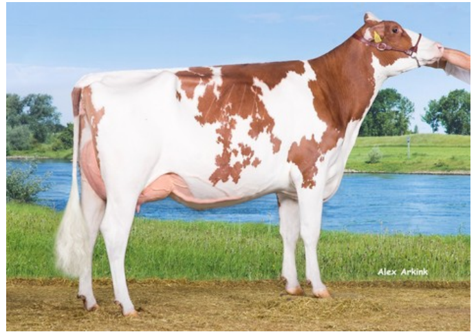
Drouner AJDH Aiko 1288 Red EX-91

VG-88 Charley x EX-91 Olympian RC x VG-87 Freddie x EX-91 Goldwyn x EX-95 Durham x EX-93 Prelude x EX-94 Jubilant RF x EX-96 Marquis King x EX-90 Brutus x EX-90 Lucifer Lad