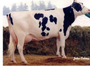
Clover-Mist Alisha EX-93