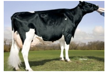
Kamps-Hollow Durham Altitude EX-95