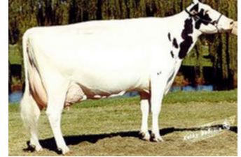
D-R-A August EX-96

VG-85 Kerrigan x Lexington x VG-85 Supersire x EX-90 Superstition x EX-91 Goldwyn x EX-95 Durham x EX-93 Prelude x EX-94 Jubilant RF x EX-96 Marquis King x EX-90 Brutus