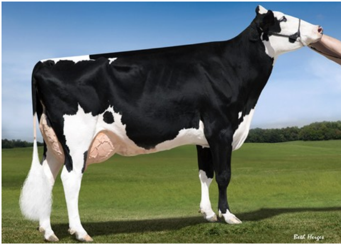
KHW Super Aderyn RC EX-90