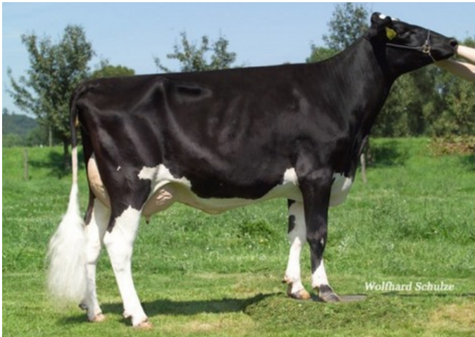
NH Shottle Island VG-86