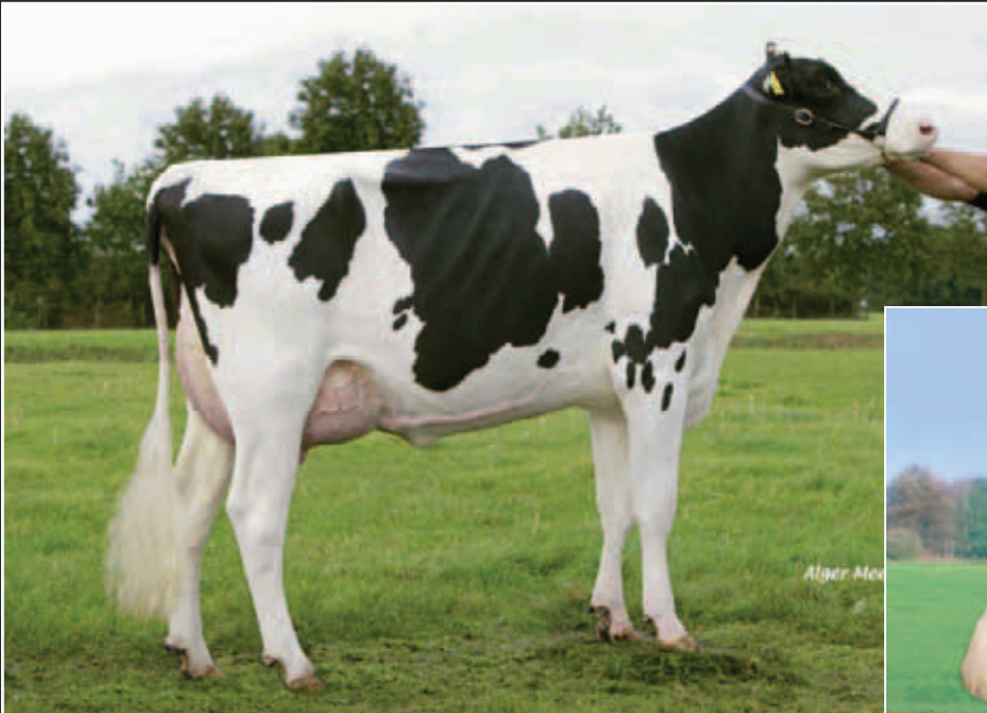
Excellence Destry Denice RDC VG-85 Mutter des Verkaufstieres / Dam of Lot No. 27