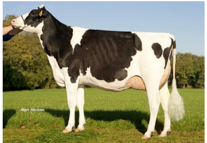
Zandenburg Iota Ebony, family member

Boss x VG-86 Snowman x VG-88 Twister x VG-86 Goldwyn x VG-86 Lancelot x VG-87 Webster x VG-89 Lucky Leo x VG-86 Bellwood x VG-89 Luke x VG-86 Aerostar x EX-94 Rotate