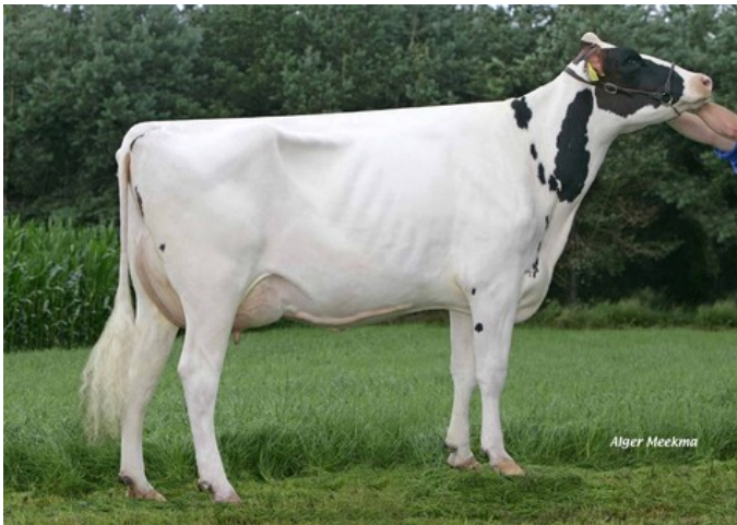
Zandenburg Twist. Ebony